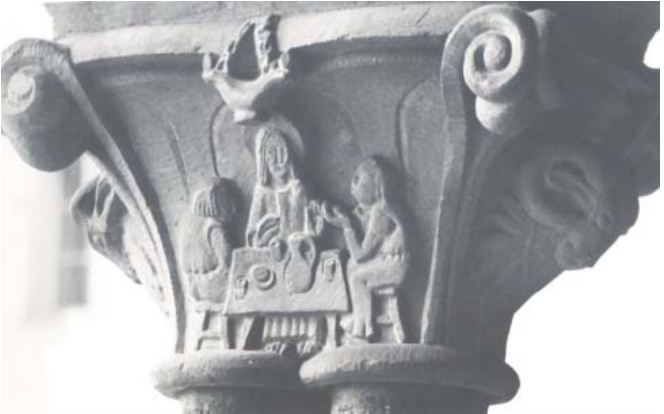
Jesus mit den Jüngern in Emmaus Kapitell im Kreuzgang von St. Matthias

Der Bericht im Lukasevangelium von den beiden Jüngern, die auf dem Weg waren nach Emmaus und die Jesus seine Gegenwart erfahren ließ, ist durch die Jahrhunderte hin von den Christen wie ein großartig leuchtendes Hoffnungssymbol gehört, gelesen und angenommen worden.