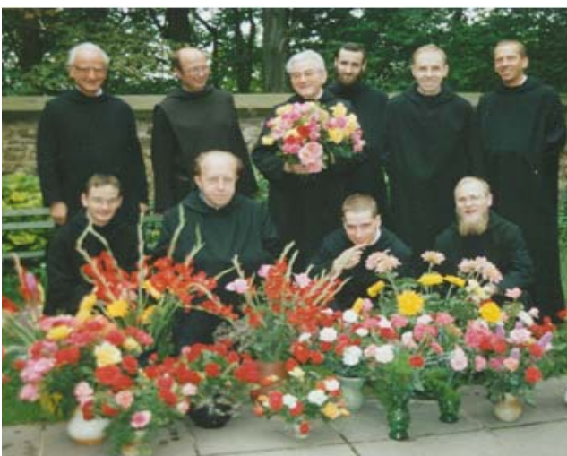
Goldenes Priesterjubiläum 1989

Mit dem Heiligen Jahr 1975 erlebt der Sechzigjährige einen Aufbruch. Exerzitien bei P. Alfred auf der Huysburg lassen ihn einen neuen Anfang wagen: Er bittet um die Freistellung zum Eintritt in die dortige benediktinische Gemeinschaft, die ihm zum 1. Mai 1976 gewährt wird. Einerseits wollte er an die persönlichen Jugend-Erfahrungen in Grüssau anknüp-