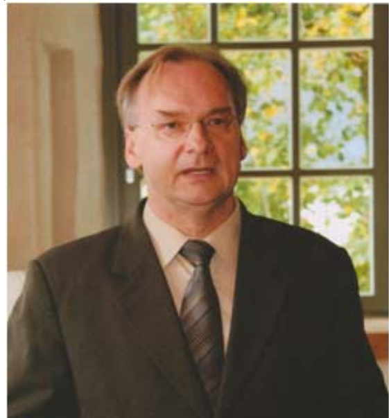
Dr. Reiner Haseloff