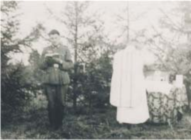
Feldgottesdienst in Russland

und lässt seinen Entschluss ahnen, auch in widrigen Umständen, sich für andere zu öffnen und sich für sie einzusetzen.